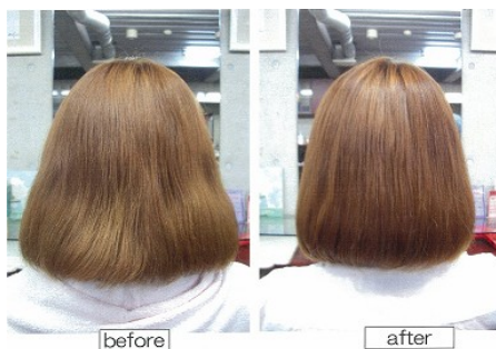
ハニエル トリートメントシステム後